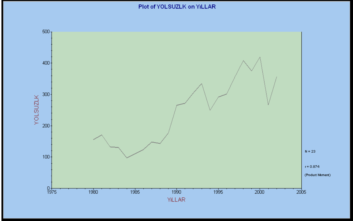
Şekil.3 Yolsuzluğun yıllara göre değişimi